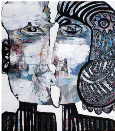
Vjenčanje, 90 x 80 cm, akril na platnu, 2022