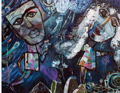
Igra na vjetlu, 146 x 114 cm, akril na platnu, 2022