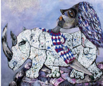
Na rubu , 130 x 110 cm, akril na platnu, 2022