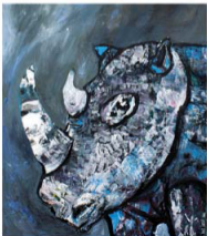
Nosorzi , 90 x 80 cm, akril na platnu, 2023