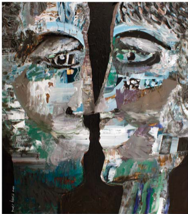
Noćna scena, 90 x 80 cm, akril na platnu, 2022