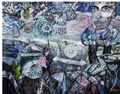
U požari, 146 x 114 cm, akril na platnu, 2022